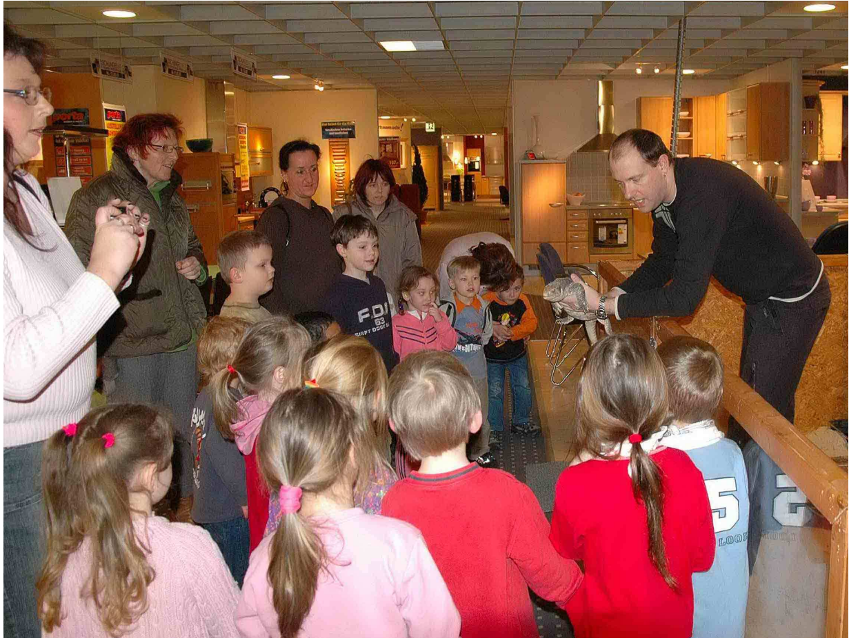
Leuchtende Kinderaugen und faszinierte Eltern beobachten unsere Vorführung

Die Ausstellung wird von unserem fachkundigen Personal begleitet, so dass die "Dschungelwelt" mit verschiedenen Programmen noch lebendiger wird. Laden Sie Schulklassen und Kindergärten zu einem lebendigen Biologieunterricht ein und profitieren Sie von dieser indirekten Werbung. Auch die Presse und das Fernsehen sind bei uns in erfahrenen Händen. Tierfütterungen und Vorführungen machen unsere Ausstellung zu einem unvergessenen Erlebnis für Groß und Klein.